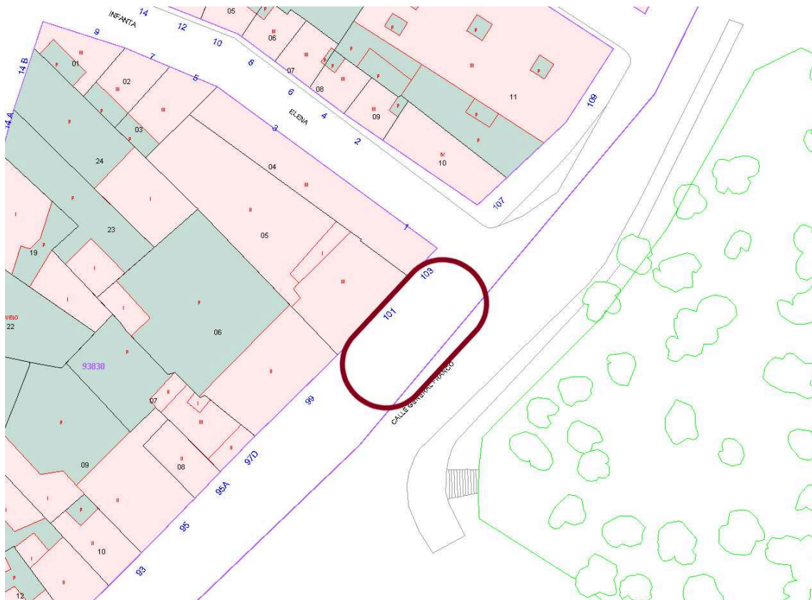
fig.1 _ plano ubicación catastral _ plazas aparcamiento viario - avenida de Trujillo - nº 101-103.

1. Las parcela objeto de la presente valoración se ubica en la red viaria municipal zona de la avenida de Trujillo, entre los números 101-103, ocupado actualmente por dos plazas de aparcamiento con una superficie aproximada de veinticinco metros cuadrados (25m 2 ), con una dimensión aproximada por plaza de aparcamiento de dos metros y cincuenta centímetros (2,50m) de ancho por una longitud de cinco metros (5,0m). Dichas parcelas no cuentan con referencia catastral por encontrarse ubicadas en el viario público.