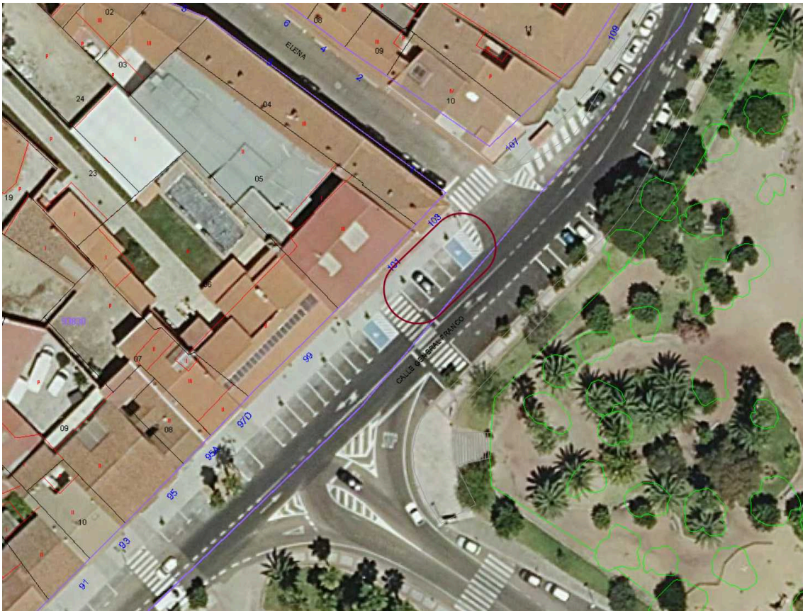
fig.2 _ foto aérea catastro _ plazas aparcamiento viario - avenida de Trujillo - nº 101-103.